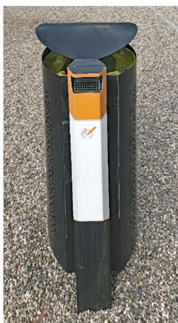
Figure 1 : Cendrier public photographié à Genève en 2018

Dans le but de rendre les cendriers publics plus efficaces, le « cendrier-sondage » a été développé dans certains pays. Ce dispositif ludique, inspiré de la théorie du « nudge » e , encourage les personnes à jeter leur mégot en répondant à une question ( figure 2 ). En dépit des bonnes intentions qui ont probablement inspiré sa création, ce cendrier aggrave la banalisation du tabagisme en donnant à la cigarette une connotation amusante et positive.