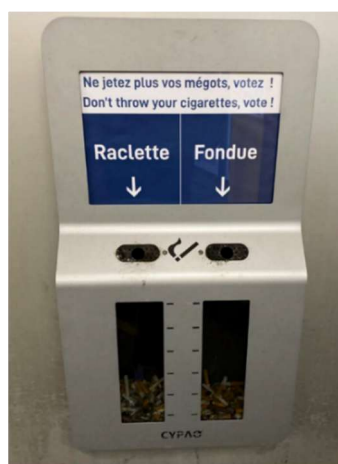
Figure 2 : Cendrier « sondage » photographié à Genève en 2020