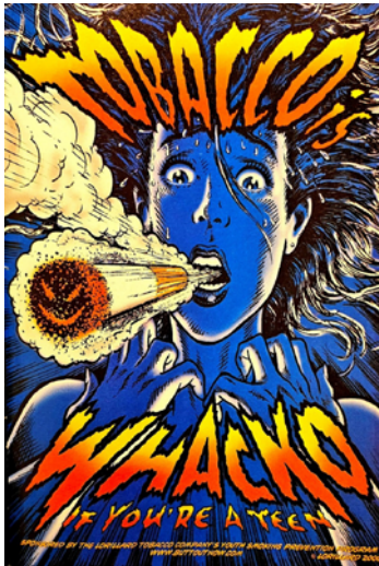
Abbildung 3 – Kampagne „Tobacco is whacko“ („Tabak ist irre“) von Lorillard (USA, 2000). 11

Das Plakat im grafischen Stil der Marvel-Comics zeigt eine sichtlich verängstigte Jugendliche, die mit voller Wucht von einer Zigarette getroffen wird. Die leuchtenden Farben, die übertriebene Strichführung und die Panik im Gesicht des Mädchens machen das Bild zur Karikatur. Insgesamt erinnert das Bild an eine Szene aus einem Horrorfilm, in der das Böse durch die Zigarette personifiziert ist.